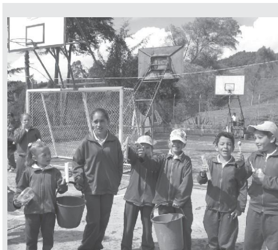
Emprendimiento: Venta de comestibles