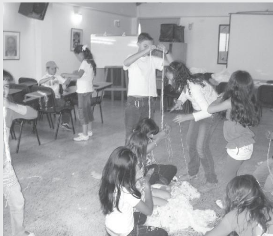
Emprendimiento: Taller de Trapeadoras