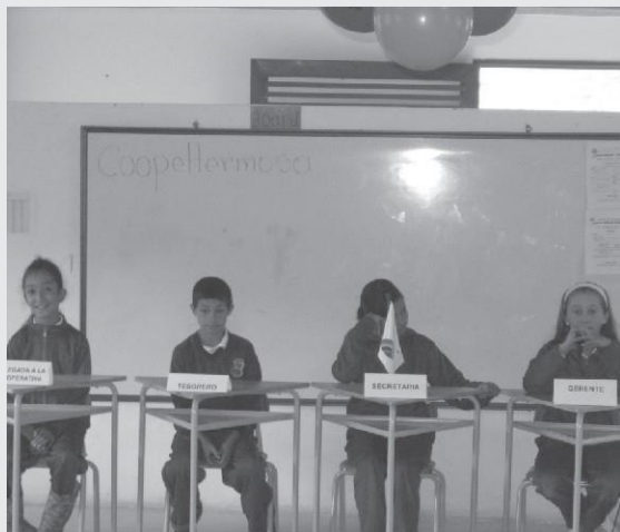
Junta Directiva Cooperativa Escolar